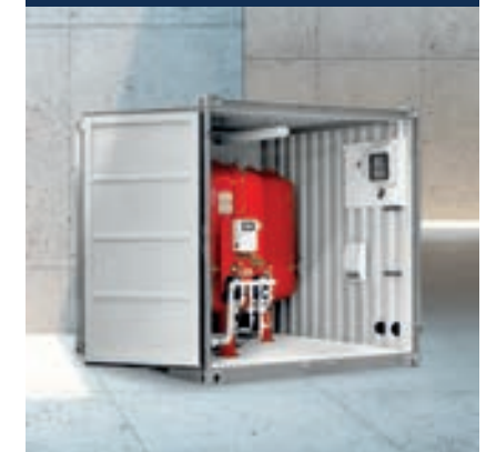
Druckhaltung- und Entgasung

Alle Serviceleistungen unter https://www.mobiheat.de/de/service